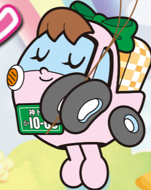
神奈川県トラック協会 オリジナルキャラクター 「みどりちゃん」