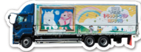
協力：川崎運送(株)様