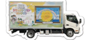
協力：株新横浜運送 様