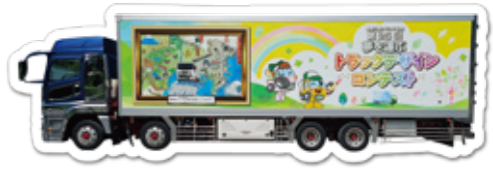
協力：(株)テイクオン 様