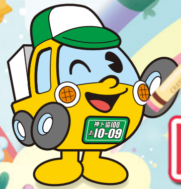
神奈川県トラック協会 オリジナルキャラクター 「トラックくん」